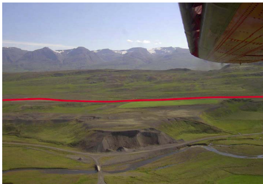
Mynd 2 Núverandi vegur og náma við Öskumel.